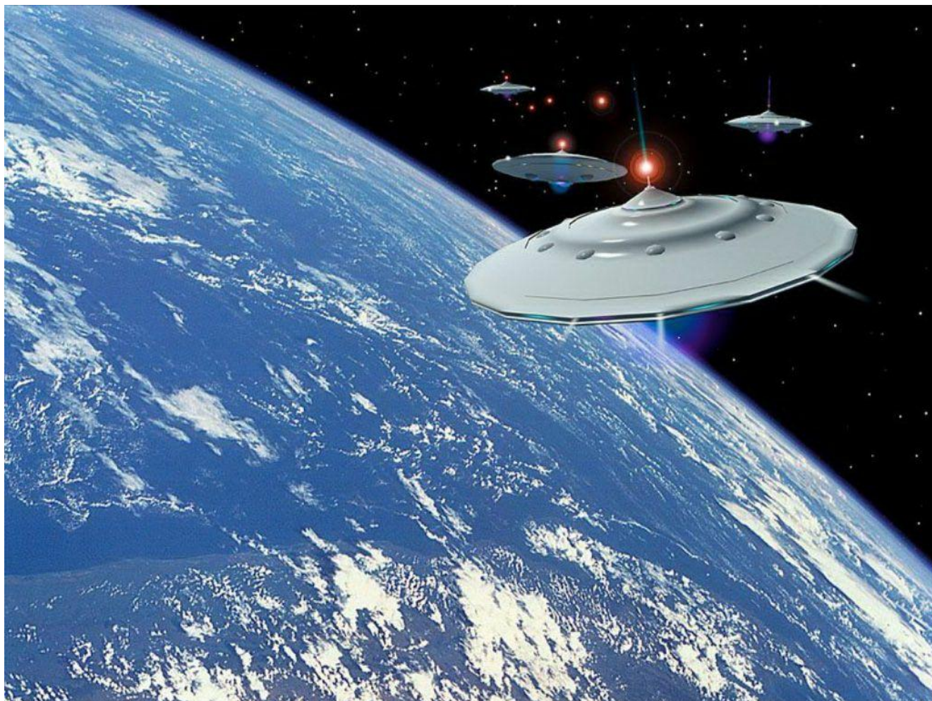
Lodě civilizace Sil světla Methária, světlo nad kokpitem je komunikační vysílač a přijímač s mateřskou lodí, která je zobrazena na obr. 127 v knize "II. Rozhovory...". Fotomontáž.